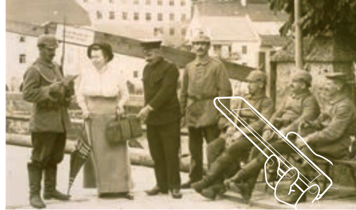
An der Grenze zu Österreich: Unter diversen Röcken verbarg sich so manche Schmuggelware. Grenzkontrolle an der alten Brücke 1914.

Wissen Sie, was man früher über die alte Brücke schmuggelte? Kennen Sie den Platz, an dem eine Jazz-legenden verhaftet wurde? Und warum ist Burghausen ein besonders gutes Pflaster für Lausbuben?