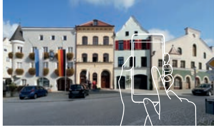
Kraiburg ist ein Paradebeispiel für die farnefrohe Inn-Salzach-Architektur mit ihren Grabendächern und den langgezogenen Fassaden.