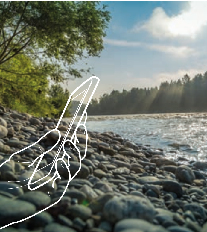
Alles im Fluss: Der Inn hat viele spannende Geschichten zu erzählen.

Begleiten Sie den Inn ein Stück auf seinem Weg von der Quelle Richtung Ozean. Auf zehn unterhaltsamen Stationen erzählt er Ihnen Geschichten von heute und aus längst vergangenen Zeiten.