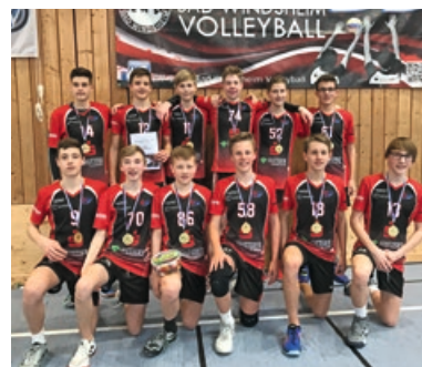
Hallenvolleyball, U 16 männlich, Bayerischer Meister