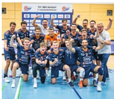
Hallenvolleyball, Herren 1 Aufstieg in die 2. Bundesliga