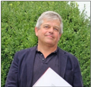
Giorgio Hillebrand Musikschule