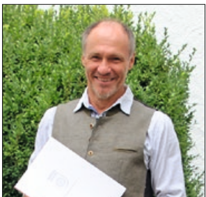
Armin Stockerer Musikschule